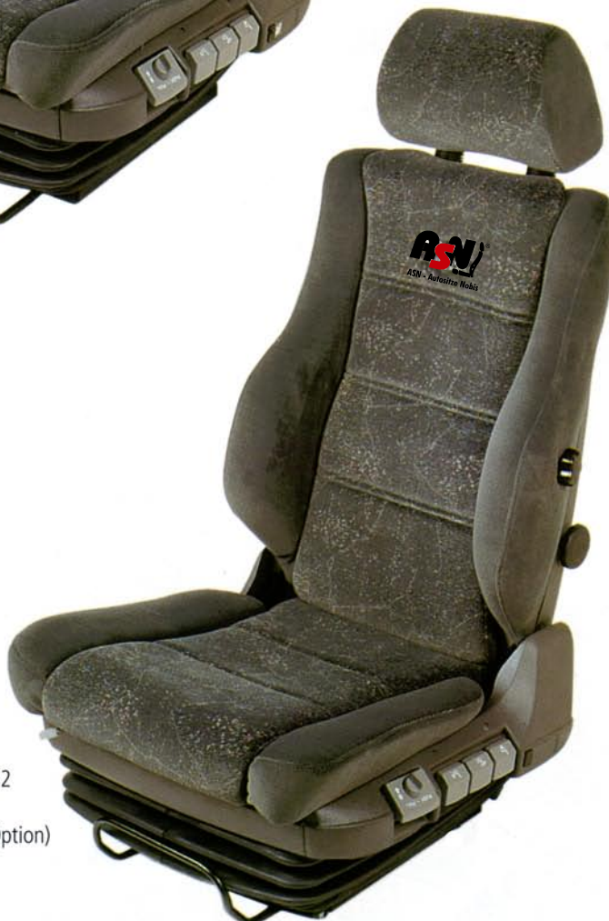
Ohne integr. Gurt Typ 22-00-S2 Auf Wunsch mit 4-Wege Lordosenstütze S-4 Schukra (Option)