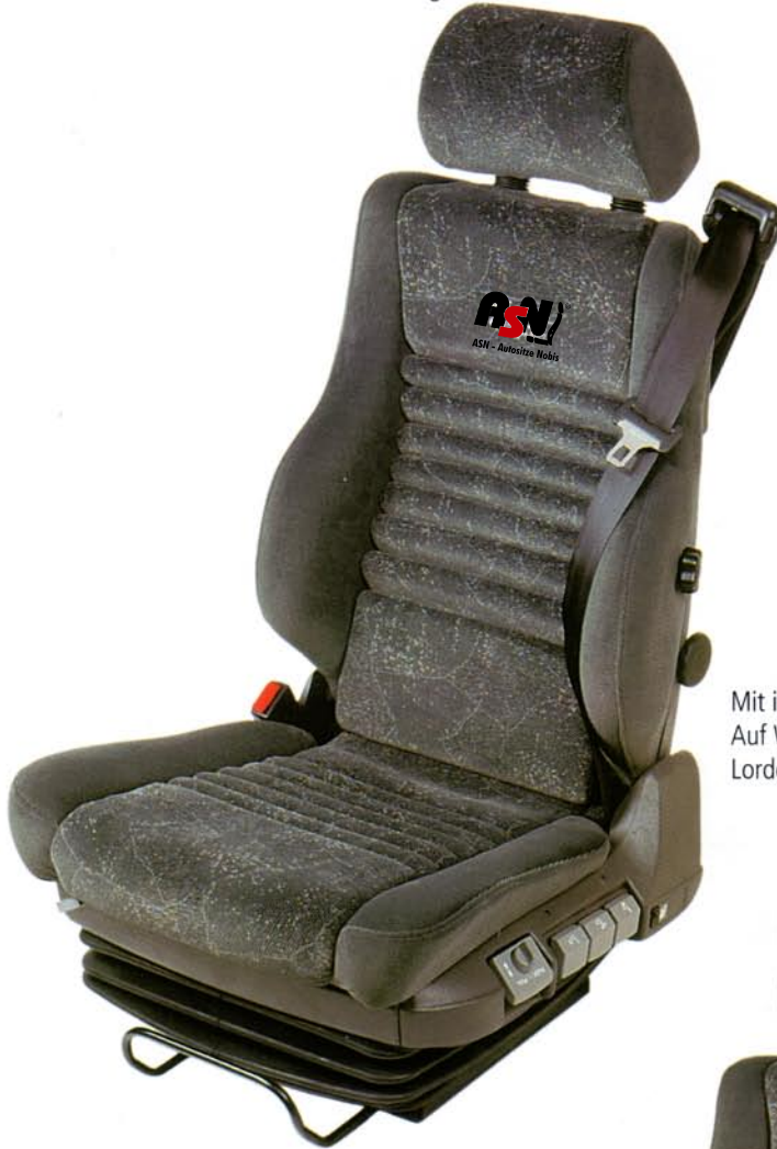
Mit integr. Gurt Typ 33-10-S2 Auf Wunsch mit 4-Wege Lordosenstütze S-4 Schukra (Option)

Die neue Generation der BE-GE by König Aktivsitze verzichtet bewußt auf Elektronik und beschränkt sich bei der Bedienung und Verstellung auf das nützliche, sinnvolle und notwendige. Wo wir uns bei den BE-GE by König Modellen nicht beschränken, ist das Bestreben Ihnen für Ihren Rücken, Wirbelsäule und Bandscheiben das Beste zu bieten. Die Modelle der Serie 33-00 vereinen alles was zur aktiven Revitalisierung geeignet ist. Wir bieten den einzigen Fahrersitz, der in der exklusiven Kombination mit Detensor Lamellensystem und der weltweit anerkannten Schukra Lordosenstütze permanent aktiv für Ihren Rücken arbeitet. Das erschien uns wichtig!